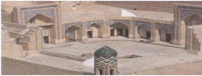
Medresa de Moukhammed-Amin-Kan en Uzbekistan